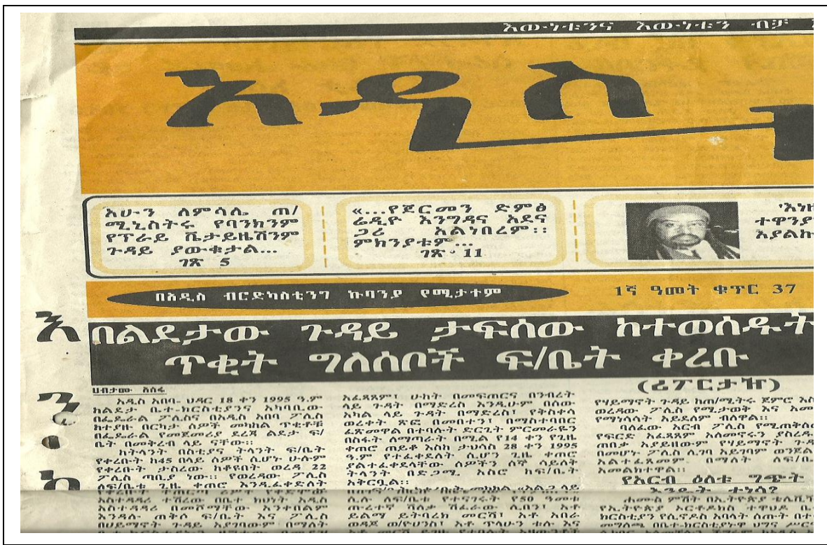
አዲስ ዜና ጋዜጣ 15ኛ ዓመት ቁጥር 37 ክልደታ የተያዙት ፍ/ቤት መቅረባቸውን የዘገበበት

በመቶ የሚቆጠሩ ሰዎች በፖሊስ ቆመጥ፣ የተወሰኑት ማምሻውን በጥይት ጭምር የቆሰሉ ቢሆንም በቴሌቪዥን በአመጸኞቹ ስምንት ፖሊሶች ቆሰሉ አንዱ በፅኑ የቆሰለ በመሆኑ ፖሊስ ሆስፒታል ሲተኛ ሌሎች ህክምና አግኝተው ሔደዋል ተባለ። በአመጹ የቤተክርስቲያን በርና መስኮት ሰብረዋል ሲሉ አከሉ። አስቀድሞ በቴሌቪዥን ሲቀርብ የነበረው ወንጀል ተጠናክሮ ቀጠለ።