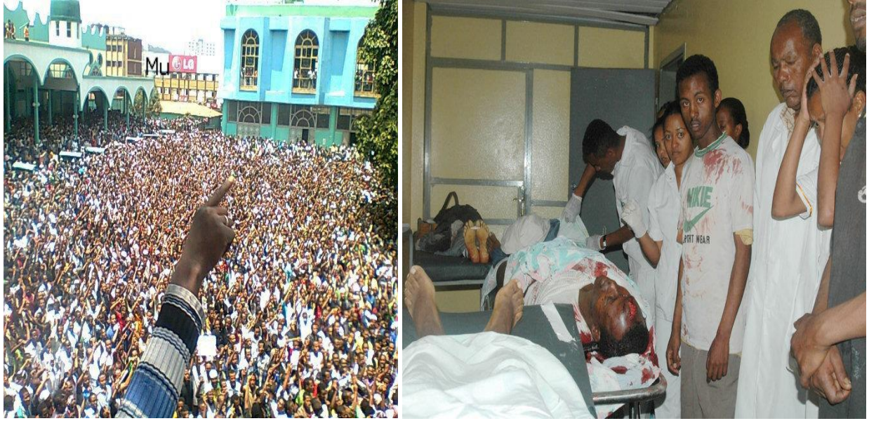
የሙስሊሞች ሰለማዊ ተቃውሞ እና የአገዛዙ የጭካኔ እርምጃን በከፊል የሚያሳይ ፎቶ

የአቶ መለስ ዘረኛ የህዋሃት አገዛዝ (መለስ ሞቱም ናሩ እድሉን እስካገኘ መቀጠል የሚፈልገው ቡድን) ትላንት ክርስቲያኖችን በመደብደብ የሙስሊሞቹ ወኪል መስሎ ለመታየትና በዕምነቱ ተከታዮች መካከል ግጭት ለመቀስቀስ በታቦት መውረጃ ካልጠፋ ቦታ ለመስጊድ ቦታ እየመራ ትልቅ ውጥረቶችን በየቦታው እየፈጠረ ጥርጣሬን እያስፋፋ ለመዝለቅ ሞክሯል።