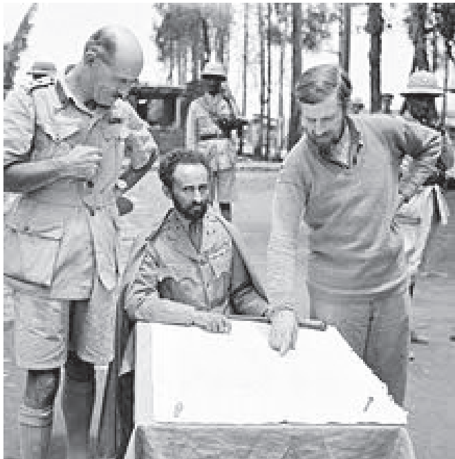
ከግራ ወደ ቀኝ ውንጌት ኃይለማህላል እና ሳንፎርድ

ከሰባት አመት በኋላ በ1914 ዓ.ም በኢትዮጵያ የብሪታኒያ ሊጋሲዮን ቆንስላ በመሆን ተመድበው ለአንድ አመት ያህል ሀገራቸውን ያገለገሉት ዳንኤል ሳንፎርድ፣ የአንደኛው የአለም ጦርነት መቀስቀስን ተከትሎ ወደ እንግሊዝ የጦር ኃይልን ደግሞ ተቀላቅለው እንዲዘምቱ በተደረገላቸው ጥሪ መሰረት፣ በምዕራብ ፈረንሳይ ይካሄድ በነበረ ጦርነት በፌብሩዋሪ 1915 ጀምሮ በግዳጅ ላይ ተሰማርተው፣ በሜይ 1916 በሻለቃነት ማዕረግ አግኝተው፣ የ94ኛው ሻለቃ አዛዥ በመሆን ፣እስከ ጦርነቱ ማብቃት ድረስ በግዳጅ ላይ ቆይተዋል። ከሴፕቴምበር 1918 ድረስ በሠራዊቱ ውስጥ በልዩ ልዩ ኃላፊነት ሲያገለግሉ ከቆዩ በኋላ ራሳቸውን ከሰራዊቱ በማለል ወደ ምስራቅ አፍሪካ በማምራት ከ1920 ጀምሮ የቀዳማዊ ኃይለስላሴ አማካሪ በመሆን የኢትዮጵያ መንግሥት ተቀጣሪ በመሆን አገልግሎት ይሰጡ ጀመር።