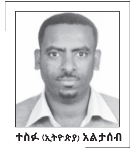
ተስፋ (ኢትዮጵያ) አልታሰብ